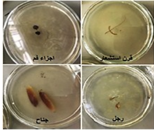
شكل (1). تحضين أجزاء الحشرة المعقمة على الوسط PSA

تكرار الفطر (%): (عدد الأجزاء التي ظهر فيها الفطر الواحد ÷ عدد الأجزاء المختبرة) \times 100 كثافة الفطر (%): (عدد عزلات الفطر ÷ العدد الكلي لعزلات جميع الفطريات) \times 100